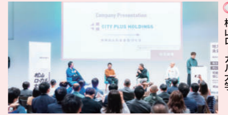
松山ローカル大学

3.美しい建築物 最近、建築視察に没頭。3月頭に、直島・豊島へ。美術館を多数作り上げた先生と同行させていただきました。また、東京出張に併せて地中図書館なども視察に行き、美しい建築物に触れた濃密な1か月。今の時流はアートとデザイン。世界の誇れる建築物に携わってみたいです。本年度もご指導・ご鞭撻のほど、どうぞよろしくお願いいたします。