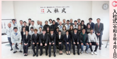
入社式 令和8年4月1日